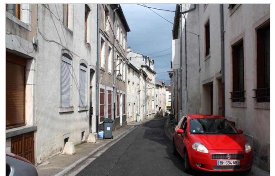
■ Une rue calme épargnée par les bombardements de 1940.

à Toul, ville de garnison, après 1870 ; le dernier d'entre eux a fermé en 1946. Pour le reste, le temps semble presque s'être arrêté depuis un siècle dans cette