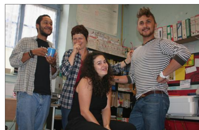
■ Les jeunes seront accueillis par quatre représentants de la Tota Compania, un ébéniste et un graphiste.

Cinq sites de la vie quotidienne mettant en lumière la nécessité de les préserver de la pollution par des gestes simples : économie d'énergie, d'électricité, tri des déchets... Bref de quoi faire de ces bouts de chou des parfaits ambassadeurs de l'écologie, et par ricochet rappeler aux plus grands (jeunes ou moins jeunes) les règles élémentaires du respect de l'environnement. Au terme de la con-